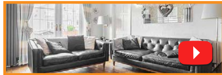
專業攝影、視頻和平面圖

觀看時間: 0:10sec Avj Homes Letting & Estate Agents 最近為我們的辦公室正面投資了新的數字屏幕, 遠離 LED 口袋。 物業實時加載到屏幕上, 屏幕上有所有物業的二維碼, 您可以使用智能手機從辦公室外下載時間表。