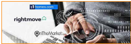
您在名牌國家門戶網站上的財產

類似於 Del Monte®, 我們相信質量和可靠性, 作為房地產經紀人, 我們只使用最好的在線房地產門戶網站, 例如 Rightmove (英國排名第一的房地產網站) 和 On The Market.com 等。