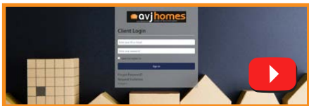
歡迎來到客戶註冊儀表板

立即試用我們新的在線預約系統! 該系統非常靈活, 可以滿足您的需求: 24/7 全天候開放預訂、直接通過電子郵件向您發送預約確認、無需致電辦公室即可重新安排或取消, 無需等待辦公室回電確認。我們讓您的潛在客戶可以靈活地登錄我們的日記並進行第二天的預約。節省時間並在線預訂!