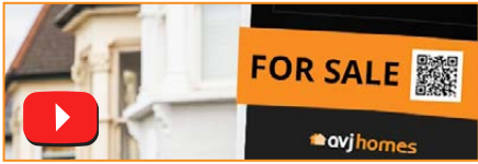
對於帶有二維碼的銷售板

觀看時間: 0:13sec 我們相信我們是第一個房地產經紀人在我們所有的板上引入二維碼。想像一下你的潛在買家走過您的財產，而不是打電話和等待對於時間表，他們可以下載立即安排。