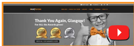
免費陪同觀看 [辦公時間]

我們贏得了多項獎項, 包括連續 5 年獲得 G44 最佳整體代理、2021 年 G44 金人獎、2020 年格拉斯哥全場銅獎我們非常感謝所有花時間給我們好評的客戶, 我們以提供理想的結果和優質的服務而自豪。